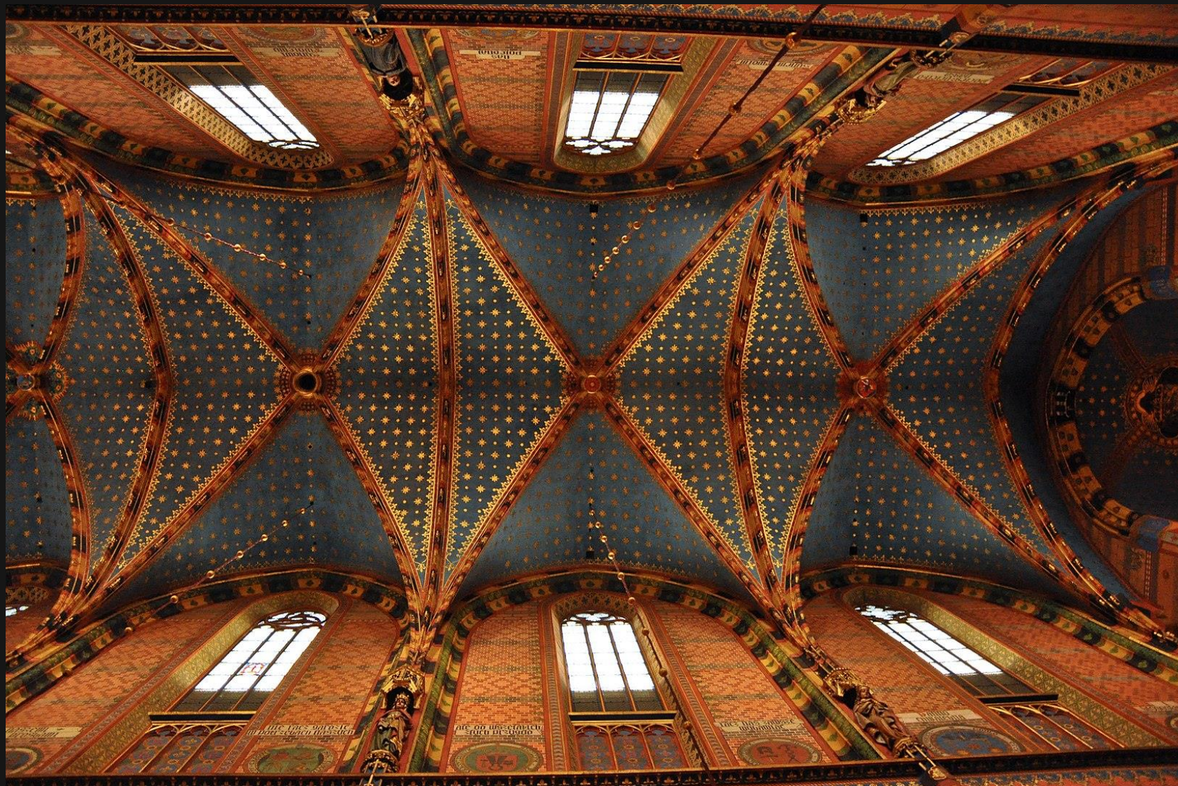
Sklepienie Bazyliki Mariackiej malowane w XIX w. przez Jana Matejkę i jego uczniów