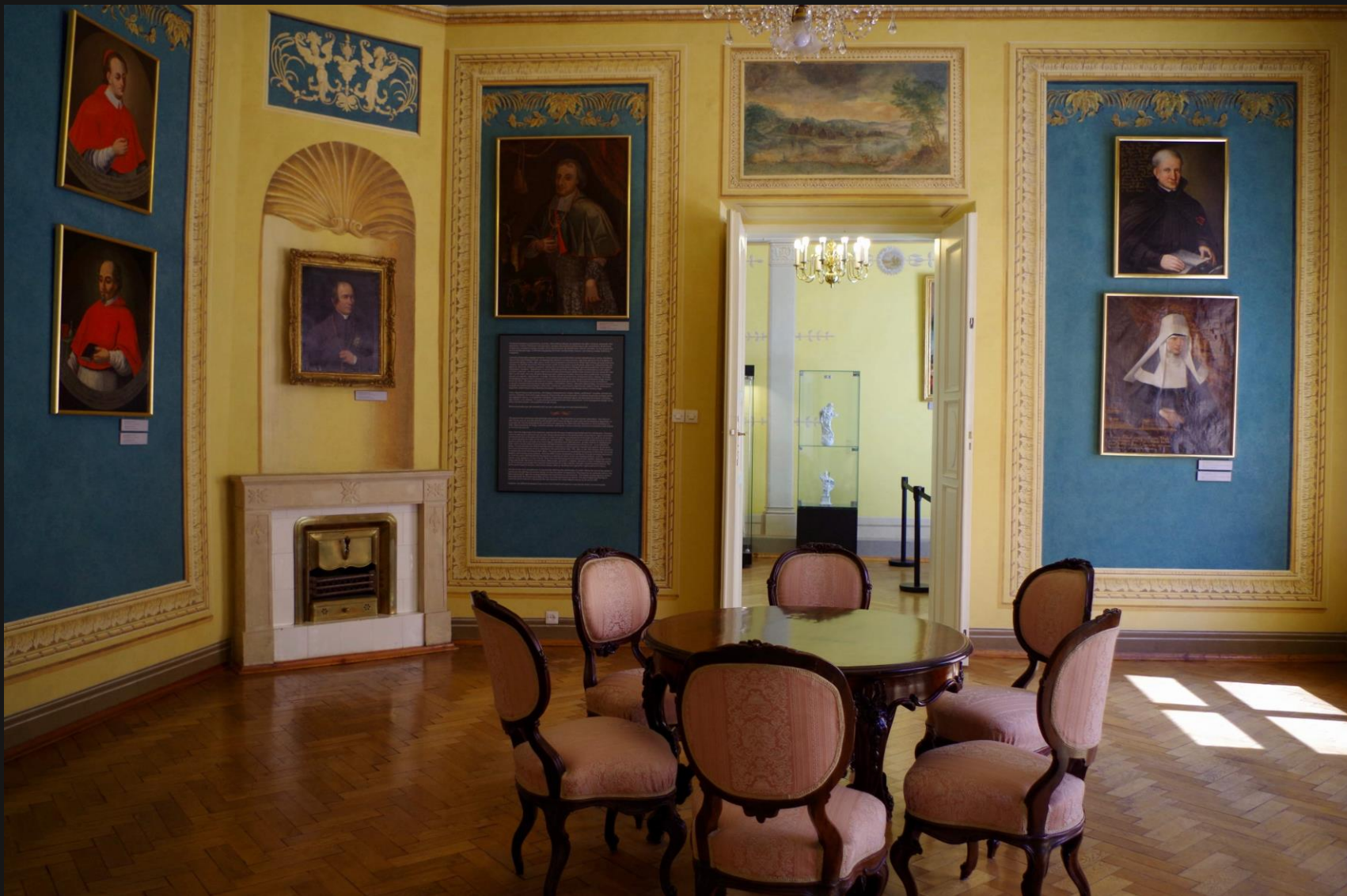
Sala kominkowa w mieszkaniu biskupa Wojtyły, ul. Kanonicza 21