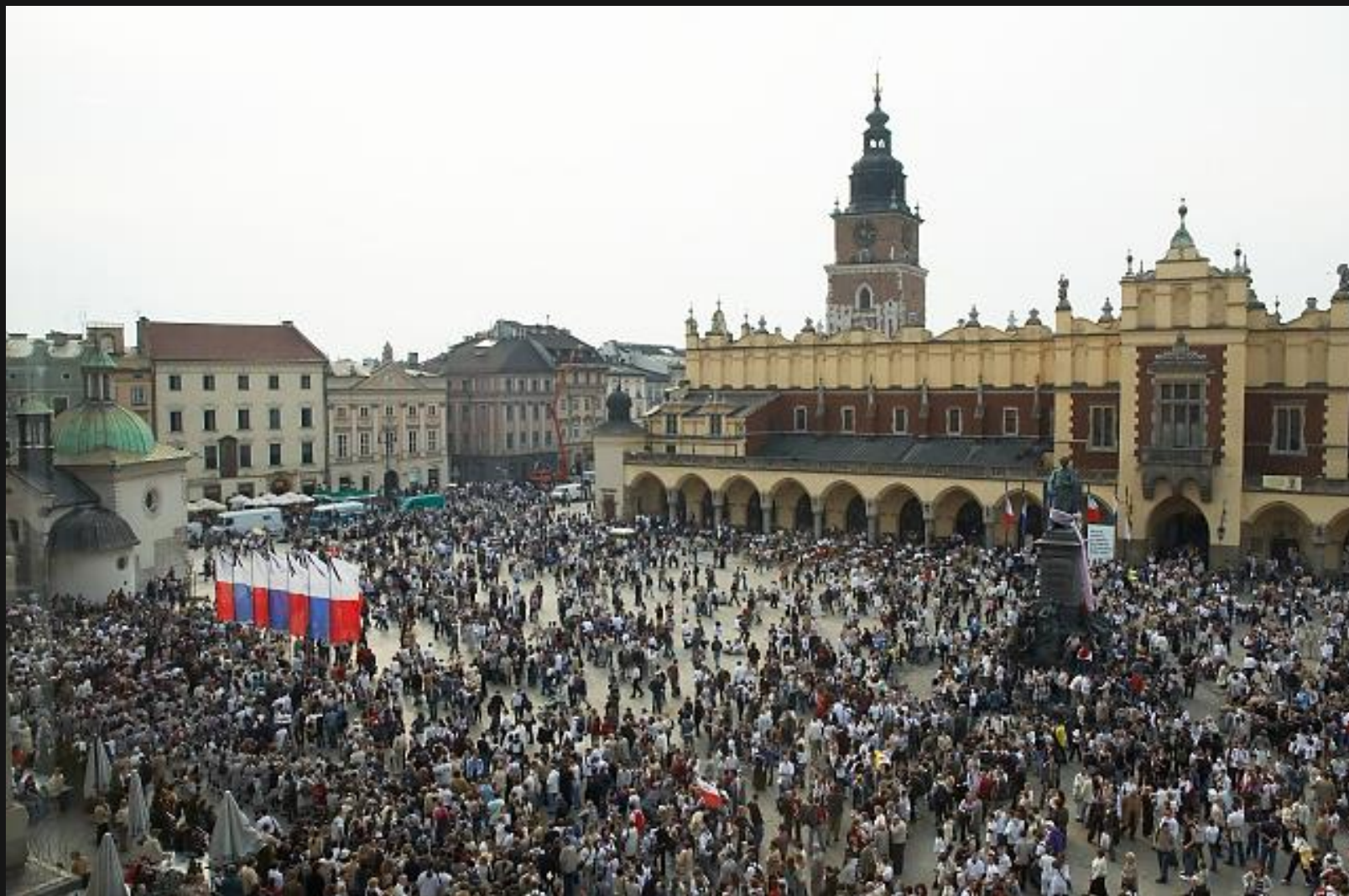
Biały Marsz Wdzięczności, który w 2005 r. wyruszył spod Bazyliki na Błonia