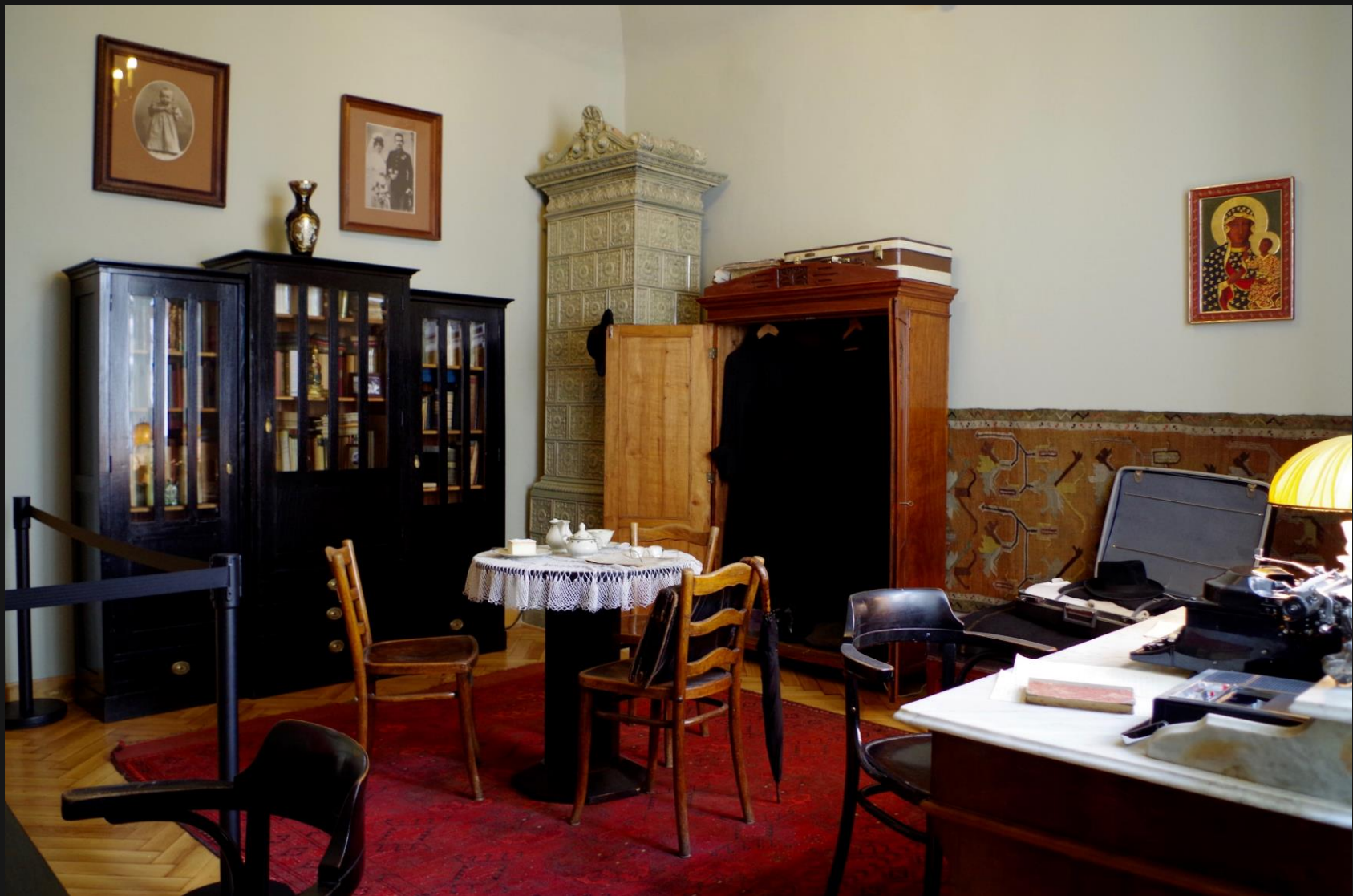
Pokój księdza Karola Wojtyły w kamienicy przy ul. Kanoniczej 19