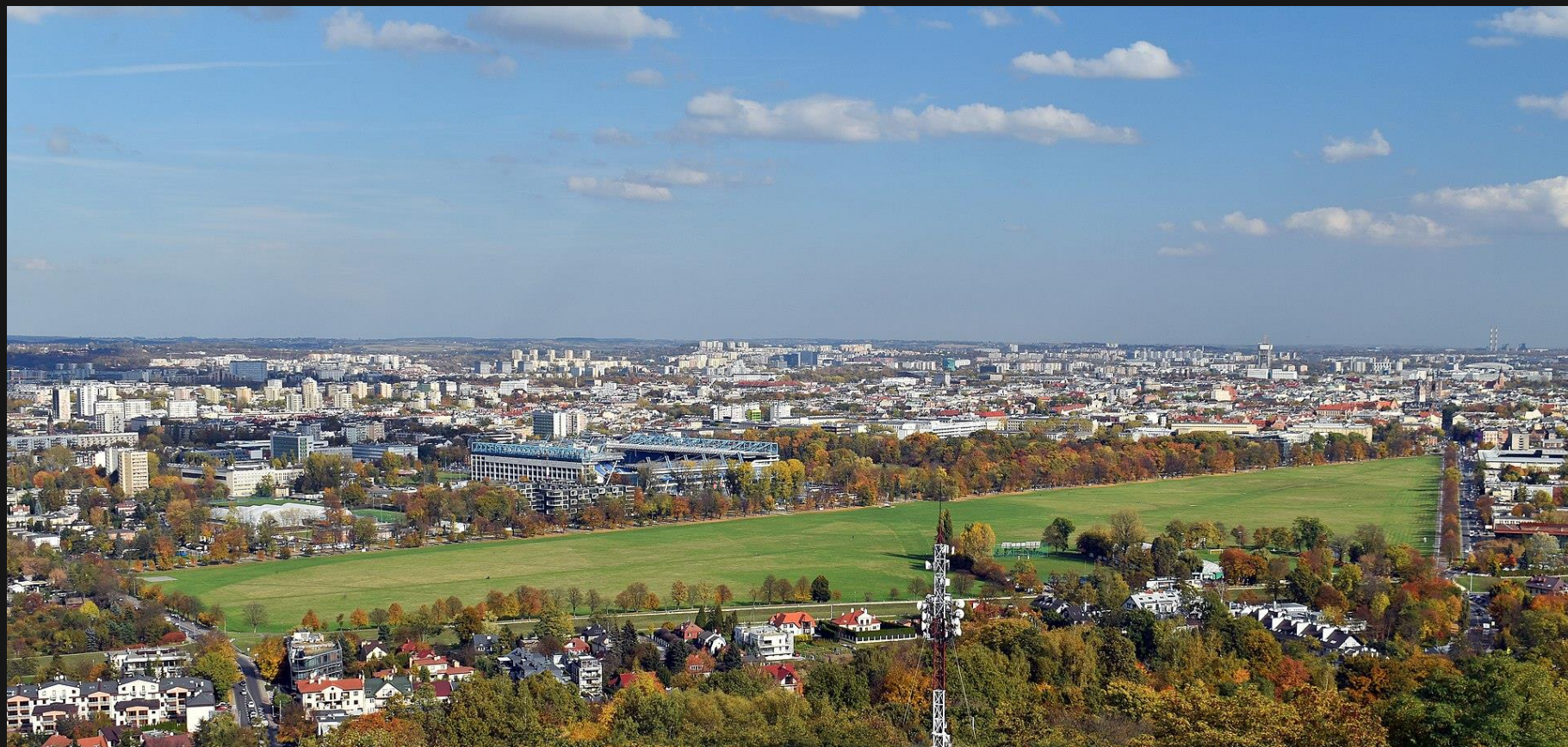
Błonia widziane z Kopca Kościuszki