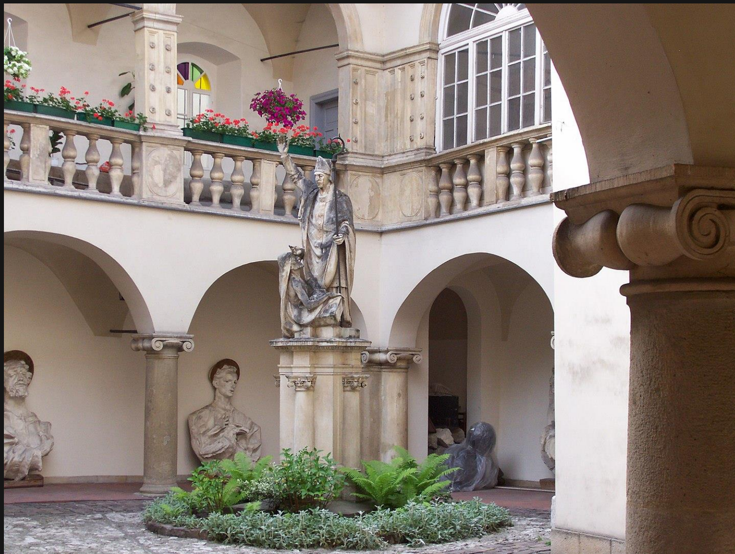
Figura św. Stanisława na dziedzińcu Domu Dziekańskiego